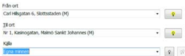
Fig.2. Utdrag ur personnotis.